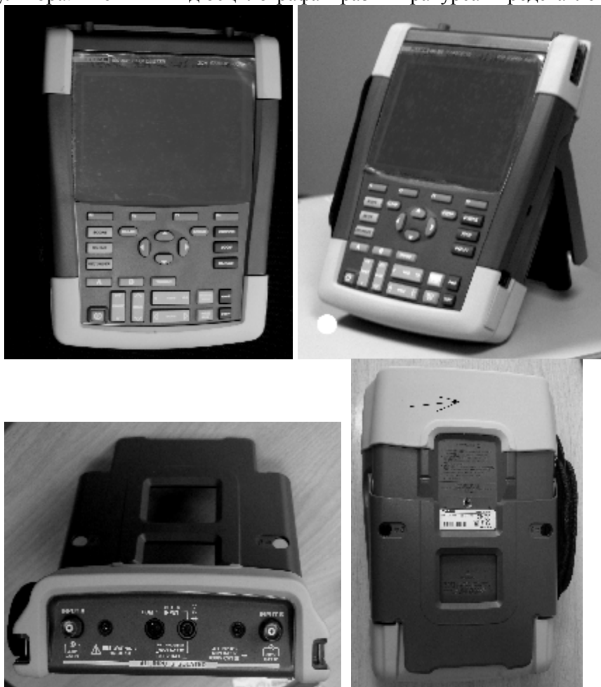
Рисунок 1 - Внешний вид осциллографа-мультиметра двухканального Fluke 190-502 в разных ракурсах. Стрелкой на нижней поверхности показано место нанесения знака утверждения типа.

Конструктивно осциллограф выполнен в ударопрочном пылезащитном корпусе и представляет собой портативный цифровой прибор, питающийся от сети или от внутреннего аккумулятора. Внешний вид осциллографа в разных ракурсах представлен на рисунке 1.